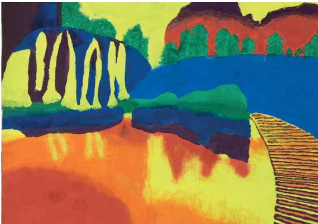
Tea Mataija, 7. razred, pejzaž Plitvička jezera