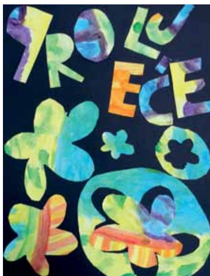
Katja Stipeč, 5. a