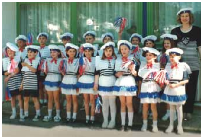
Na Cvjetnome korzu za Dan državnosti 1996. godine