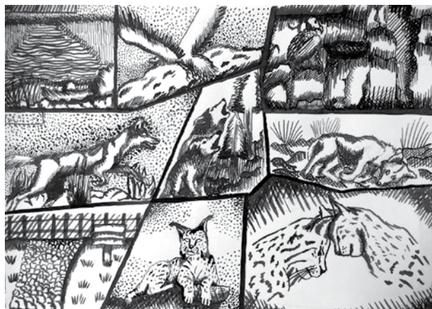
Rea Vukić, 8. r., Čuvajmo ugrožene vrste