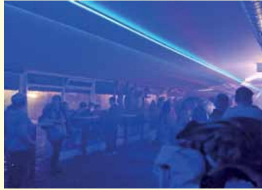
... a večer proveli uz pjesmu i ples u disco klubu na Dunavu