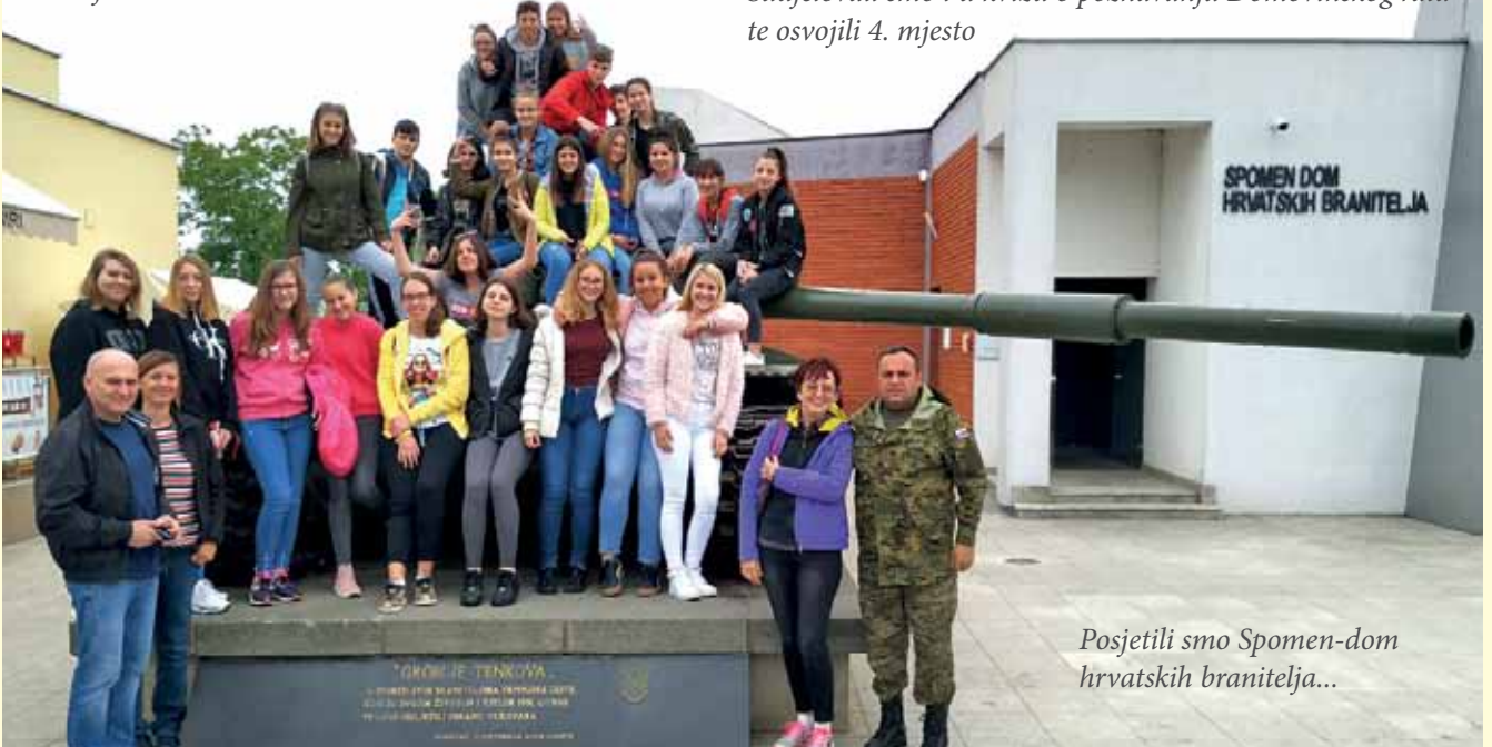
Posjetili smo Spomen-dom hrvatskih branitelja...