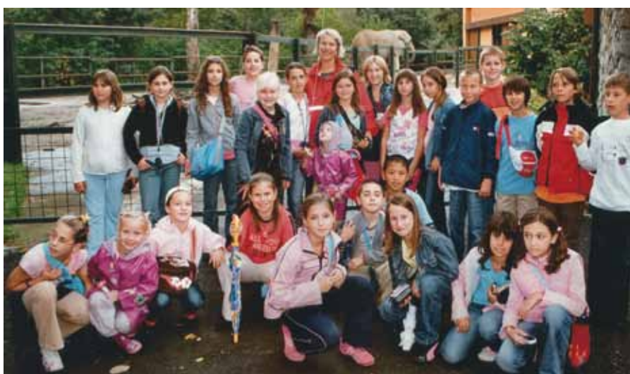
Na izletu s 4. a školske godine 2006./2007.