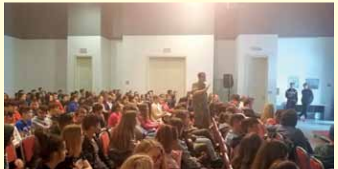
Sudjelovali smo i u kvizu o poznavanju Domovinskog rata te osvojili 4. mjesto