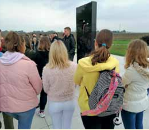
... Memorijalno groblje žrtava Domovinskog rata i Ovčaru