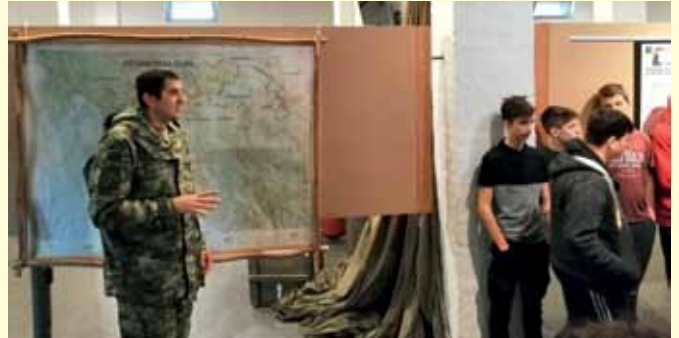
Drugi dan počeo je predavanjima u sklopu vojarne u kojoj smo odsjeli...