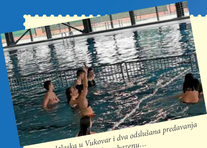
Nakon dolaska u Vukovar i dva odslušana predavanja opustili smo se u gradskom bazenu...