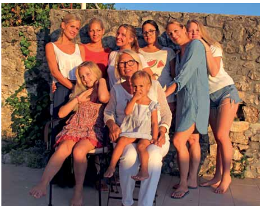
„Zbog svojih kćeri i unuka radujem se što ću sada imati više slobodnog vremena.”