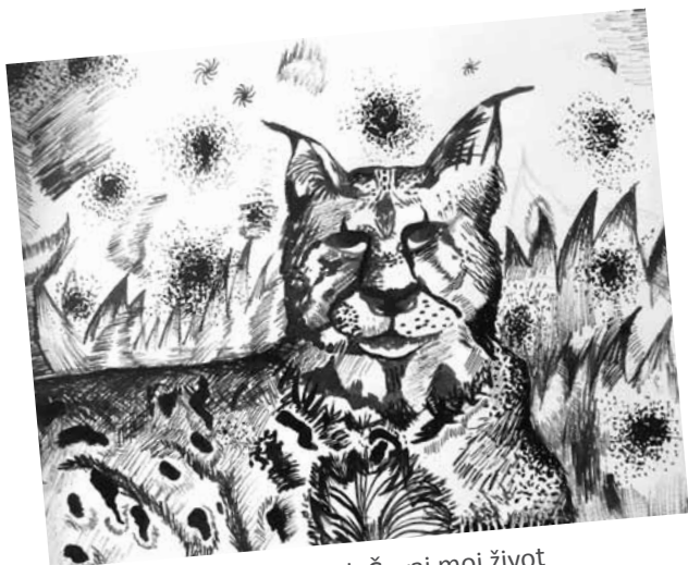
Ela Marija Vukić, 6. razred, Čuvaj moj život