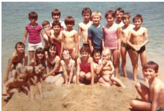
S prvom generacijom na izletu Krk – Šilo, lipanj 1981.

Dapače, bilo je bezbroj prekrasnih trenutaka, na izletima, u povorkama Cvjetnog korza, maškarama ili