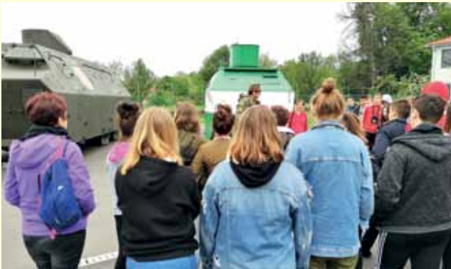
... te smo naučili mnogo o Domovinskom ratu i stradanju Vukovara